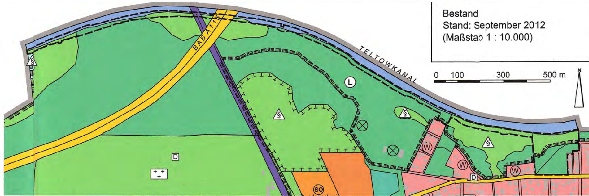
Bestand Stand: September 2012 (Maßstab 1 : 10.000)

Stahnsdorf, den 28.02.2018 [Siegel] Albers Bürgermeister