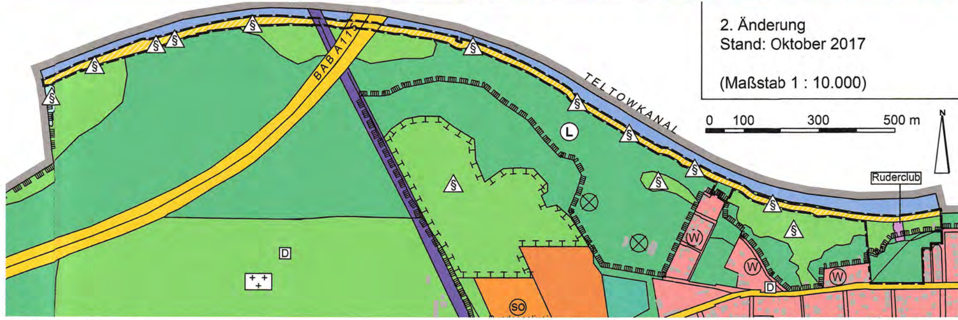
2. Änderung Stand: Oktober 2017 (Maßstab 1 : 10.000)