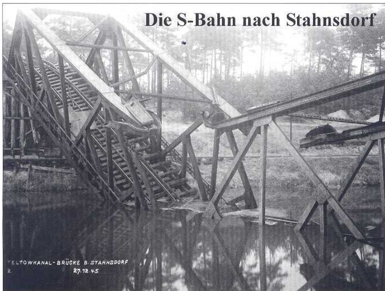
TELLOWKANAL-BRÜCKE B. STAHNSDORF 27.12.45

Die kriegszerstörte Teltowkanal-Brücke der S-Bahn-Strecke Wannsee-Stahnsdorf wurde ab 1947 instand gesetzt; seit 27. Mai 1948 führen die Züge wieder nach Stahnsdorf – bis der 13. August 1961 die Stilllegung der Strecke erzwang. Die „Friedhofsbahn“ hat eine besondere Geschichte, eine traurige Gegenwart – und vielleicht doch noch eine Zukunft?