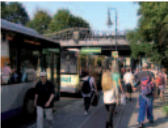
Gute Anschlüsse zum Berliner Schnellbahnnetz – S Mexikoplatz

Berlin-Brandenburg (VBB) und Ihre Havelbus Verkehrsgesellschaft