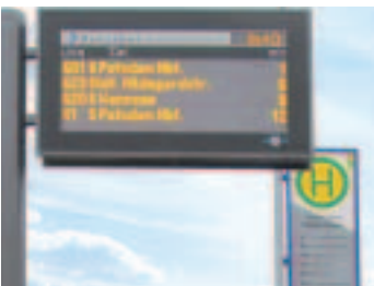
Die Fahrgastinformation in der Region wurde verbessert