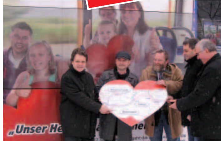
Das neue TKS-Busnetz bietet den Fahrgästen seit Dezember 2010 bessere Verbindungen nach Potsdam und Berlin

Sieben neue Anzeigetafeln am Kleinmachnow-Rathausmarkt, in Teltow an der Warthestraße und in Stahnsdorf an der Waldschänke zeigen den Fahrgästen jetzt in Echtzeit, wann der nächste Bus kommt. Seit Oktober kann man am wichtigen Verknüpfungspunkt Waldschänke trocken, von einem Dach geschützt, auf den Bus warten.