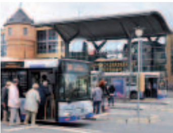
Alle 10 Minuten erreichbar: der Hauptbahnhof in Potsdam